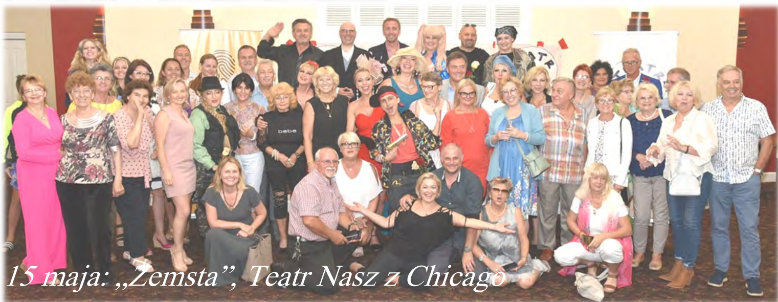
15 maja: „Zemsta”, Teatr Nasz z Chicago