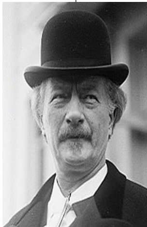
Ignacy Jan Paderewski

dokonujących się w Polsce przemian polityczno-społecznych po wyborach w czerwcu 1989, w dniu 29 czerwca 1992 roku trumnę z jego prochami sprowadzono do Polski, gdzie spoczęła w krypcie archikatedry św. Jana w Warszawie. Pośmiertnie został odznaczony orderem wojennym Virtuti Militari (Wikipedia 2018r)''