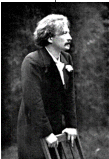
Ignacy Jan Paderewski w początkowym okresie kariery pianisty